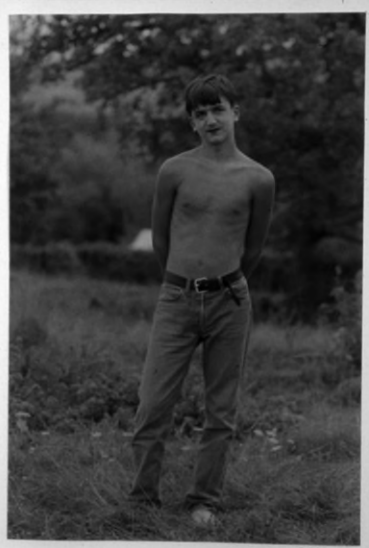
Collier Schorr: Swimming Pool Eyes, 1996, Schwarzweißfotografie, Courtesy Stuart Shave/Modern Art, London und 303 Gallery, New York