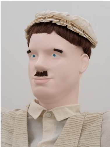
Jos de Gruyter & Harald Thys, Mondo Cane (The Town Crier), 2019, Mechanisierte Puppe, Installationsansicht aus MONDO CANE, kuratiert von Anne-Claire Schmitz, Belgischer Pavillon, Venedig Biennale, 2019, Foto: Nick Ash, Courtesy die Künstler und Galerie Micheline Szwejcer