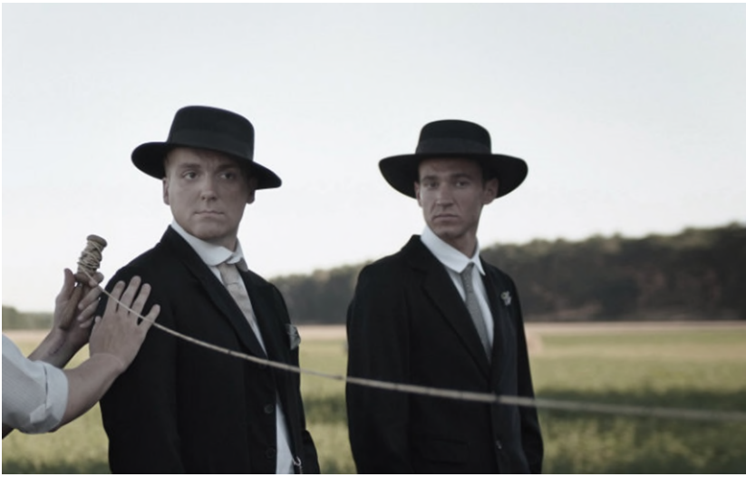
Omer Fast: August, 2016, Stereoskopischer Film in 3D, Courtesy der Künstler und Filmgalerie 451, Berlin