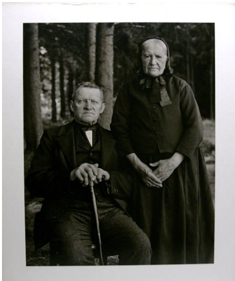
August Sander: Bauernpaar – Zucht und Harmonie. Porträts aus „Menschen des 20. Jahrhunderts“, 1912-32, © Die Photographische Sammlung/SK Stiftung Kultur – August Sander Archiv, Köln; VG Bild-Kunst, Bonn, 2022