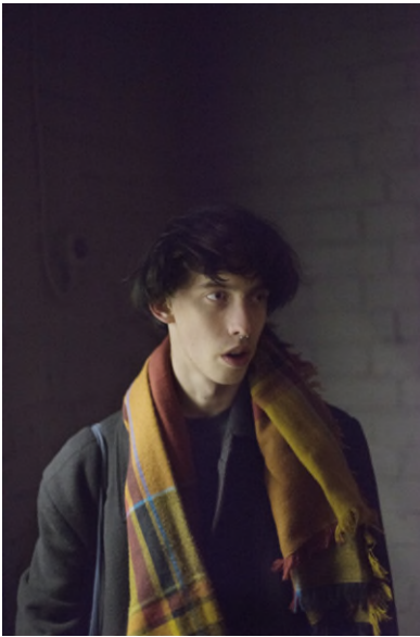
Tobias Zielony: Daniels, aus der Serie „Golden“, 2018, Archival Pigment Print, Courtesy der Künstler und KOW, Berlin