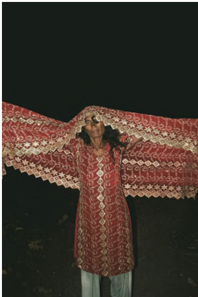
Soham Gupta: Angst, 2013–2017, 20teiliger Inkjet-Print, © Soham Gupta, Museum Folkwang, Essen