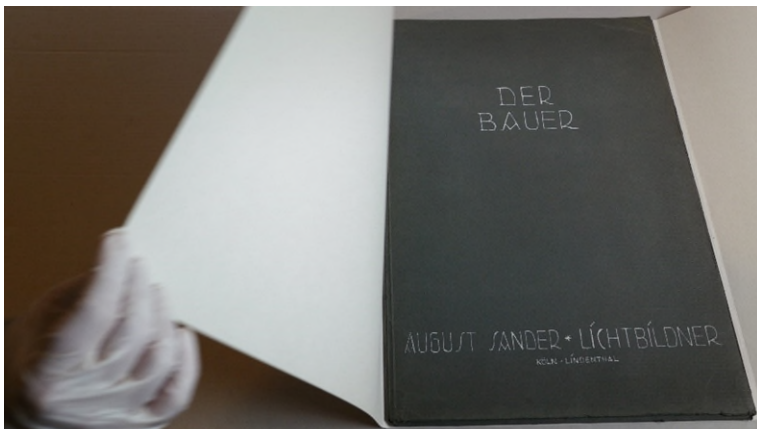
Sandra Schäfer: Westerwald: Eine Heimsuchung, 2021, Videostill, © VG Bild-Kunst, Bonn 2022 Courtesy die Künstlerin