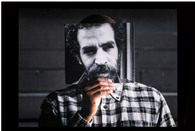
Bouchra Khalili: The Tempest Society, 2017, Digitalvideo, Courtesy die Künstlerin